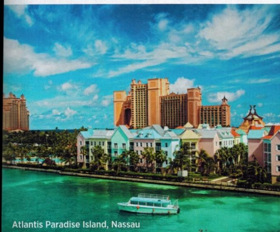
Atlantis Paradise Island, Nassau