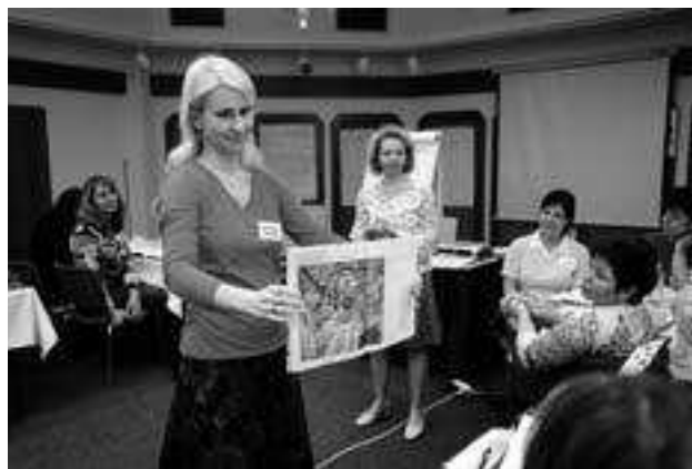
Čteme s nečtenáři.

Dostala jsem možnost vstoupit do projektu Nová škola zabývajícího se čtenářskou gramotností v rámci čtenářských klubů určených hlavně pro nečtenáře nebo děti ze sociálně znevýhodněného prostředí. Na vstupní setkání projektu, které se konalo v Praze v hotelu Olšanka, jsem jela plna očekávání. Tuto práci jsem si