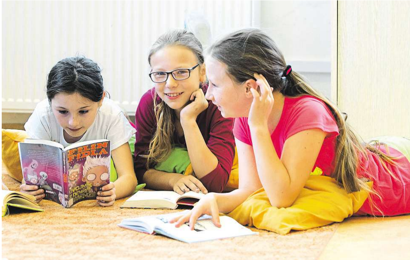
Čtenářský klub Na Základní škole v Přílepech se do něj napoprvé přihlásila asi polovina ze třiceti školáků od druhé do páté třídy.

Klíčové je, že učitel nedostane „jen“ seznam povinné literatury, jak tomu bývalo dřív. Je na něm, co vymyslí. A možnosti, jak dětskou kníž-