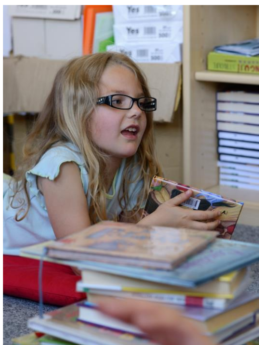
(Nejmladší rokycanská členka klubu)