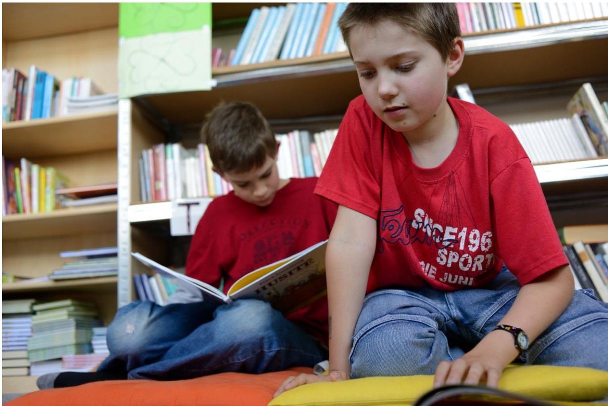
(Čtenáři z Rokycan)

„Sloveso číst nestrpí rozkazovací způsob. Tuto nechuť sdílí s několika dalšími: se slovesem „milovat“,... nebo například „snít“.