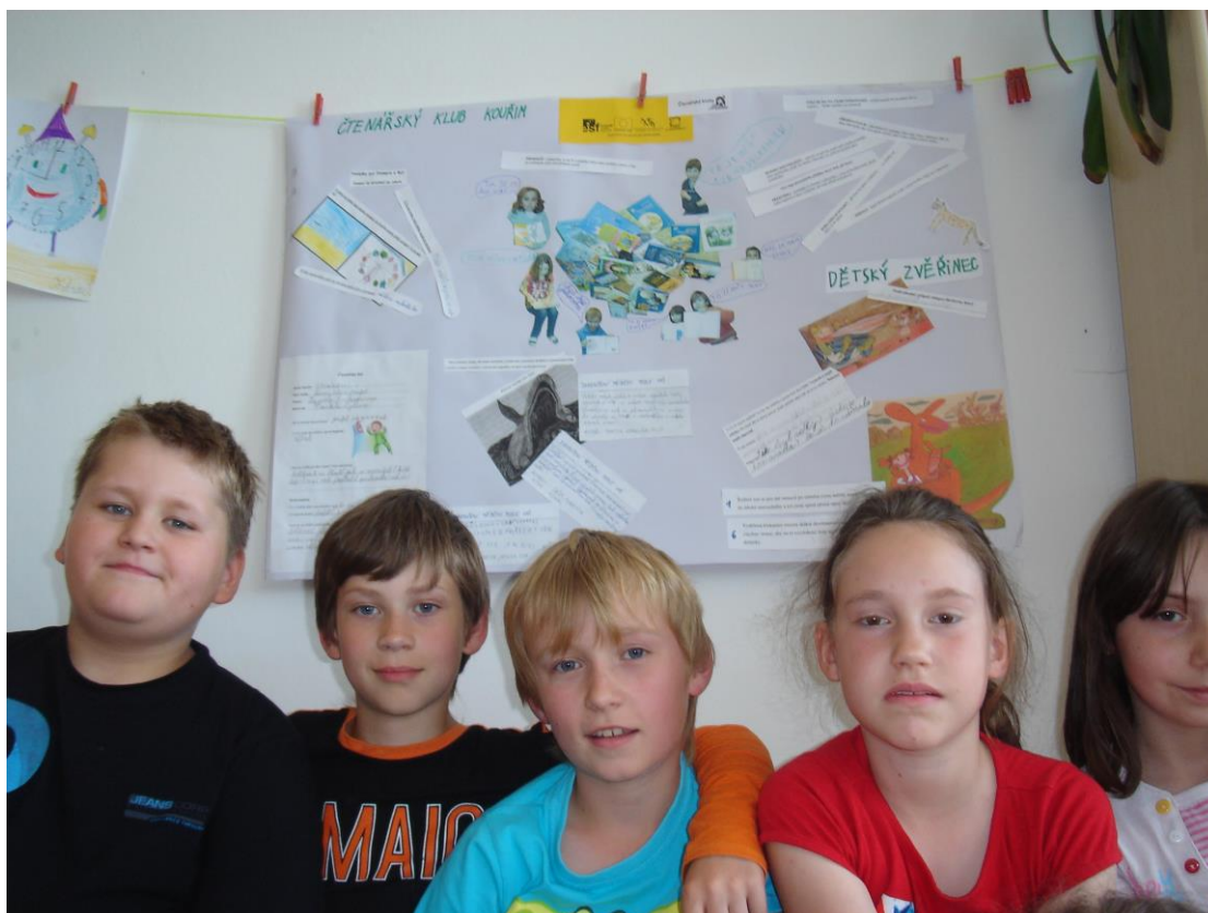
(Několik dětí z kouřimského klubu před koláží představující klubovou práci)